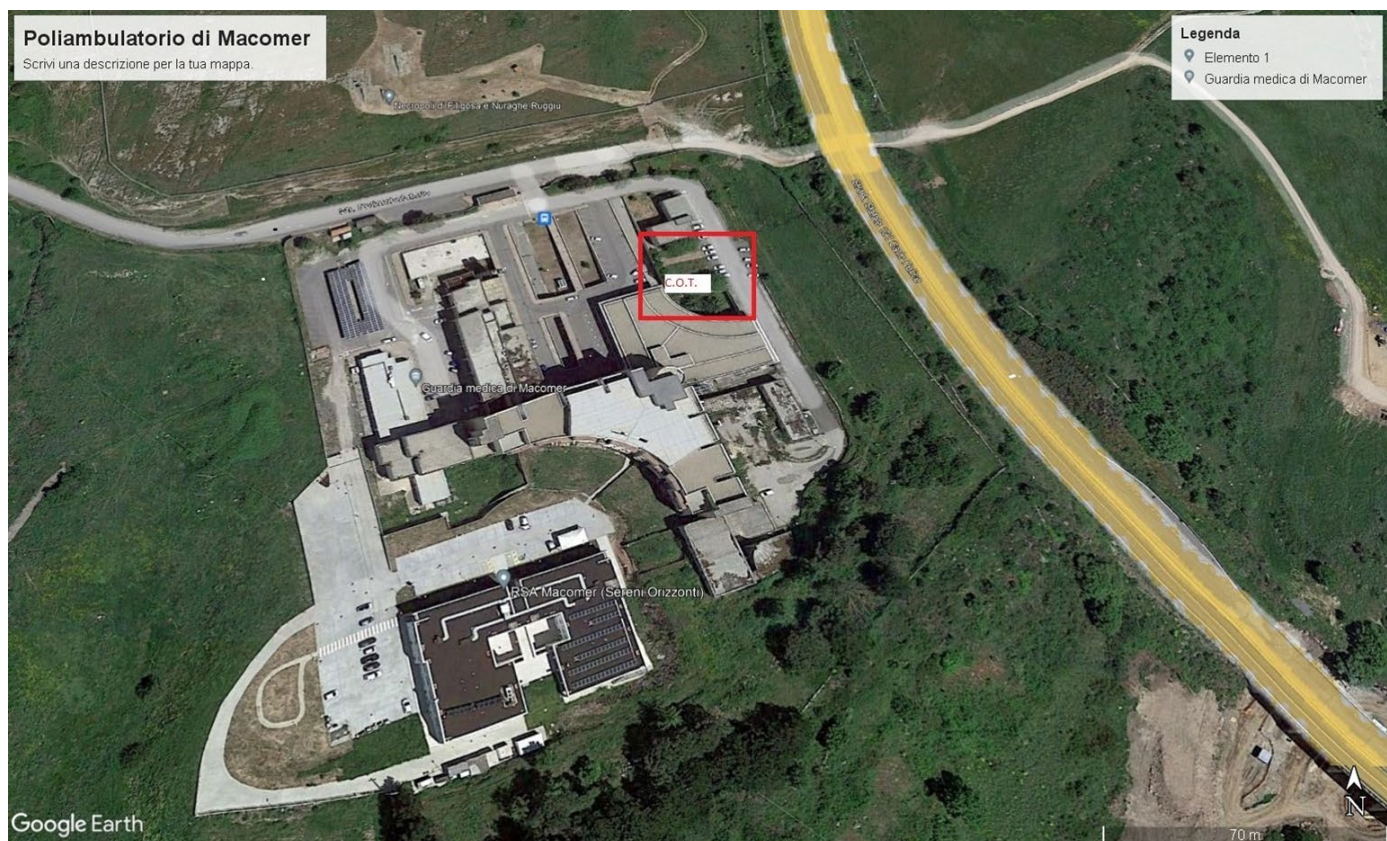
Figura 1: Area C.O.T.

L'intervento ricade all'interno del perimetro del complesso, trattandosi di nuova edificazione e per il tipo di appalto in oggetto necessita di tecniche di ingegneria naturalistica.